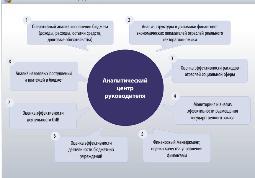
Рис. 1. Аналитический центр руководителя

Например, сопоставляя динамику финансовых показателей, таких как налог на прибыль и налог на имущество организаций строительной отрасли, и динамику экономических показателей — в данном случае объемов сдачи жилья, можно выявить значительные диспропорции, говорящие о недополучении бюджетом значительных сумм и фактически предоставлении льгот-